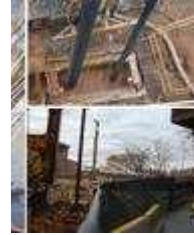
Una de les rases que s'han obert, just a prop de l'edifici. A dalt, una vista de les obres arreu.

«Vam advertir a Adif que volem informes amb dades quantificades, clares, i que els autors es comprometin que la solució que donen, a més de ser la millor, sigui contrastada amb les nostres dades, perquè si després d'aquestes anàlisis i advertències succeís alguna cosa, demandarem el responsable de l'error en qüestió.»