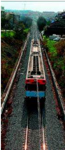
Un comboi circula per un tram de via única a Mollet, ahir.