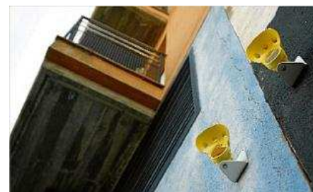
L'Administrador d'Infraestructures augmentarà els controls a les obres del tren d'alta velocitat. marc martí

El tram túnels urbans i estació de Girona, de la línia d'alta velocitat Madrid-Barcelona-frontera francesa, que compta amb un pressupost de 278.629.970 euros, té una longitud total de 3.640 metres i consta de dos túnels, excavats majoritàriament mitjançant tuneladora.