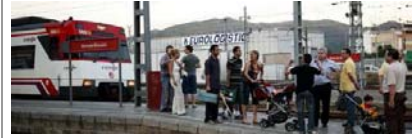
A l'estació de Montcada Bifurcació es separen les línies ferroviàries Barcelona-La Tor de Querol i Barcelona-Manresa-Lleida / Cristina Forés

Al dia següent l'Ajuntament va presentar un recurs d'apel·lació contra aquesta decisió, manifesten que l'han basat en una bateria d'arguments jurídics, urbanístics i de ciutat per tal que l'organisme judicial manifesti la improcedència de mantenir la suspensió dels decrets municipals i les obres puguin continuar aturades mentre el Jutjat Contenciós resolgui el fons de la qüestió. Estan a l'espera d'una resposta.