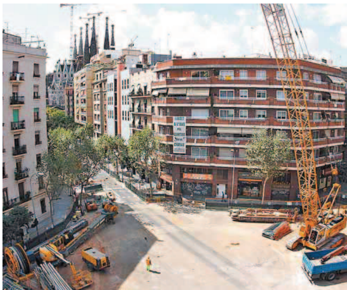
Esta semana ha empezado la construcción de las pantallas del pozo.

Ya no sólo es el polvo, el ruido, los problemas de movilidad y la disminución de clientes en las tiendas. Las obras del AVE en la calle Mallorca junto a la Sagrada Família han disparado los robos en la zona. Así lo aseguran diversos comerciantes, que explican que en los últimos meses los cacos han entrado en varios establecimientos, como Miró, un estanco y un local de juegos recreativos. Las obras han obligado a cortar carriles de circulación y provocan que la zona no sea agradable para pasear y el descenso del tráfico favorece, según explican, el aumento de delitos en la zona. La historia es parecida a la que vivieron los vecinos del Clot, donde coincidiendo con el inicio de los trabajos del AVE hubo una oleada de atracos e incluso un apuñalamiento.